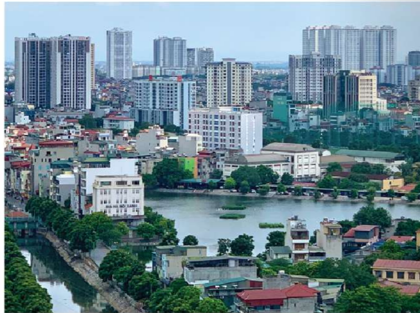
Nhà đầu tư thận trọng chờ thời cơ, chưa vội đổ tiền vào bất động sản

Qua đợt sóng sốt đất hồi đầu năm, nhiều nhà đầu tư đang thận trọng chờ thời cơ, chưa vội đổ tiền vào bất động sản (BDS). Theo các chuyên gia, nhà đầu tư nên chuẩn bị dòng vốn hướng tới đầu tư trung - dài hạn, không nên kỳ vọng nhiều vào việc lướt sóng.