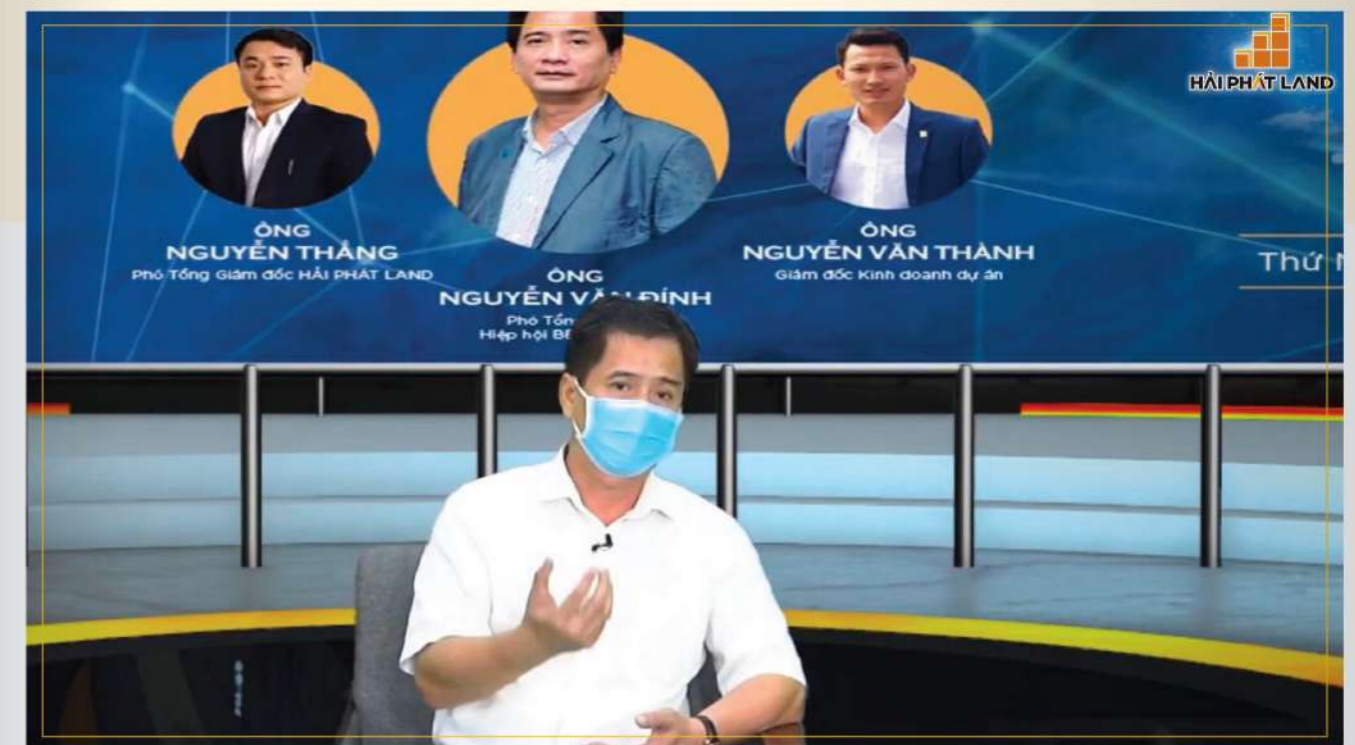
Chương trình 360 độ Bất động sản Hải Phát Land với sự tham gia của những chuyên gia đầu ngành.