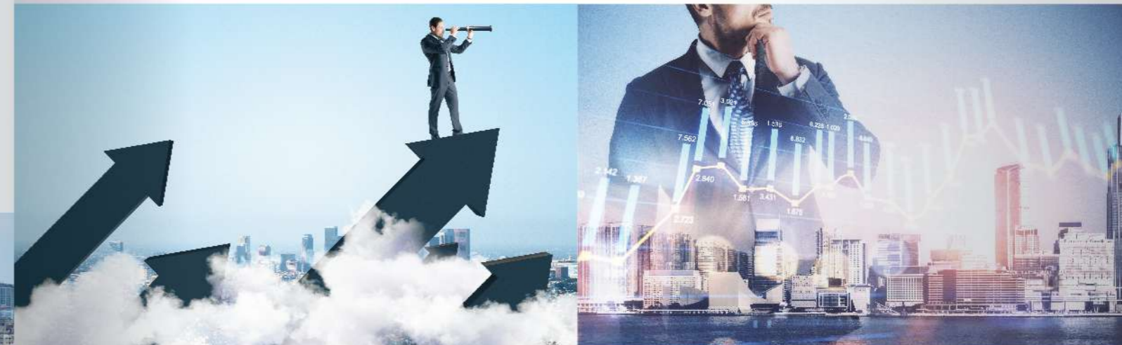
Thị trường bất động sản dự đoán sẽ sôi động vào cuối năm