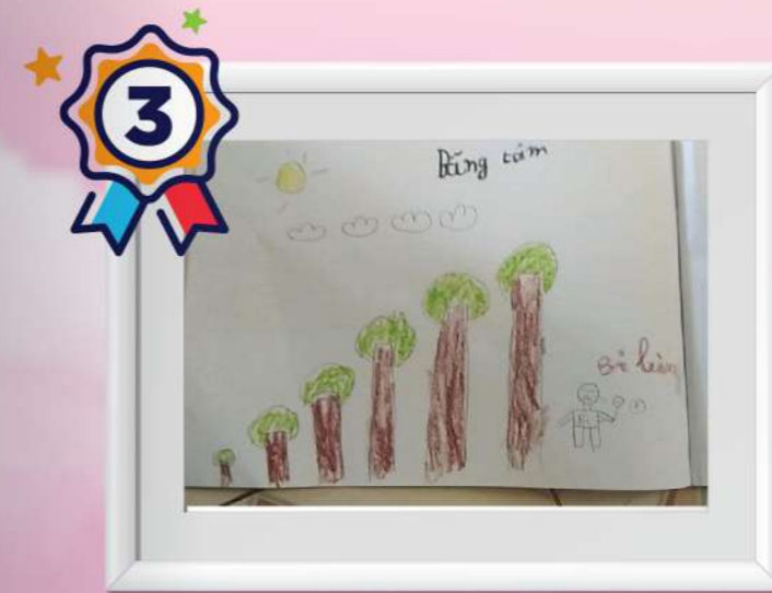
Tác phẩm BA: “Thế giới quanh ta trong xanh” Bé: Võ Băng Tâm