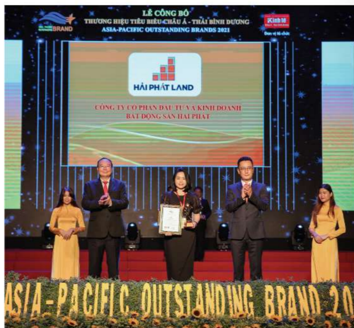
Đại diện Hải Phát Land nhận giải Top 10 thương hiệu tiêu biểu Châu Á Thái Bình Dương 2021.

Ngày 24/04/2021, vượt qua mọi tiêu chí đánh giá gắt gao từ Ban tổ chức cũng như hàng trăm ứng viên tranh giải, Hải Phát Land đã được xướng tên ở hạng mục Top 10 thương hiệu tiêu biểu Châu Á Thái Bình Dương 2021 tại Lễ công bố "Thương hiệu tiêu biểu Châu Á - Thái Bình Dương 2021" lần thứ VII - giải thưởng thường niên do Ban biên tập Tạp chí Kinh tế Châu Á - Thái Bình Dương phối hợp Tập đoàn Truyền thông Châu Á tổ chức, nhằm tôn vinh những thương hiệu tiêu biểu thuộc khu vực Châu Á - Thái Bình Dương và ghi nhận những đóng góp trong việc áp dụng khoa học công nghệ vào hoạt